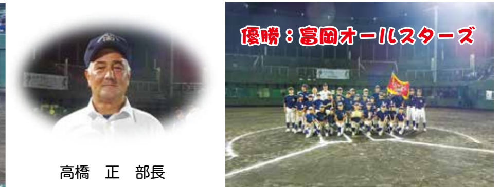
優勝：富田オールスターズ