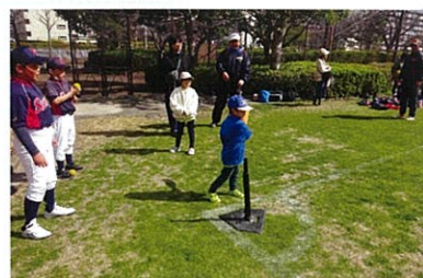
ソフトボール Tバッティング、ベースランニングを楽しみました