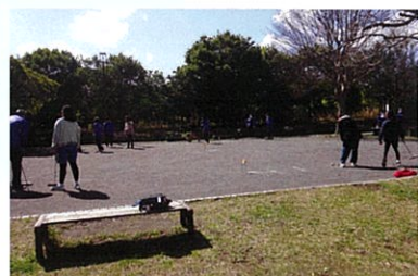
ゲートボール 小学生も多数参加で楽しく体験