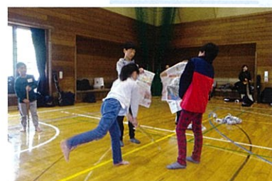
剣道 礼節・我慢・忍耐力・正しい姿勢が身につく