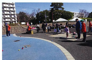
さわやかスポーツボッチャ ターゲットにむけて!エイッ!