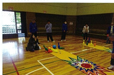
ボーリング スカットとさやかストライク!!