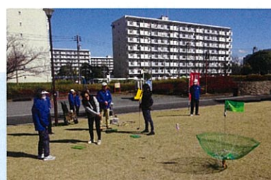
ターゲットバード・ゴルフ カゴにむけてショット!