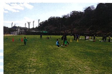
サッカー 目指せJリーガー