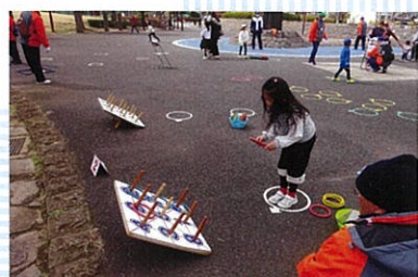
さわやかスポーツ輪投げ それっ!はいれ!