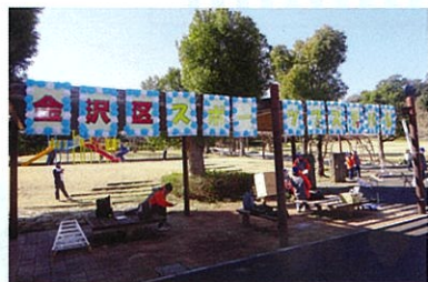
フェスティバルの看板です

令和6年3月9日(土)に長浜公園・金沢スポーツセンターを会場にスポーツフェスティバルを開催しました。好天に恵まれ、大勢のご参加をいただき、いろいろなスポーツに触れて楽しい一日を過ごしていただきました。