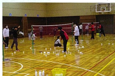
バドミントン 短時間でも皆さん上達できました